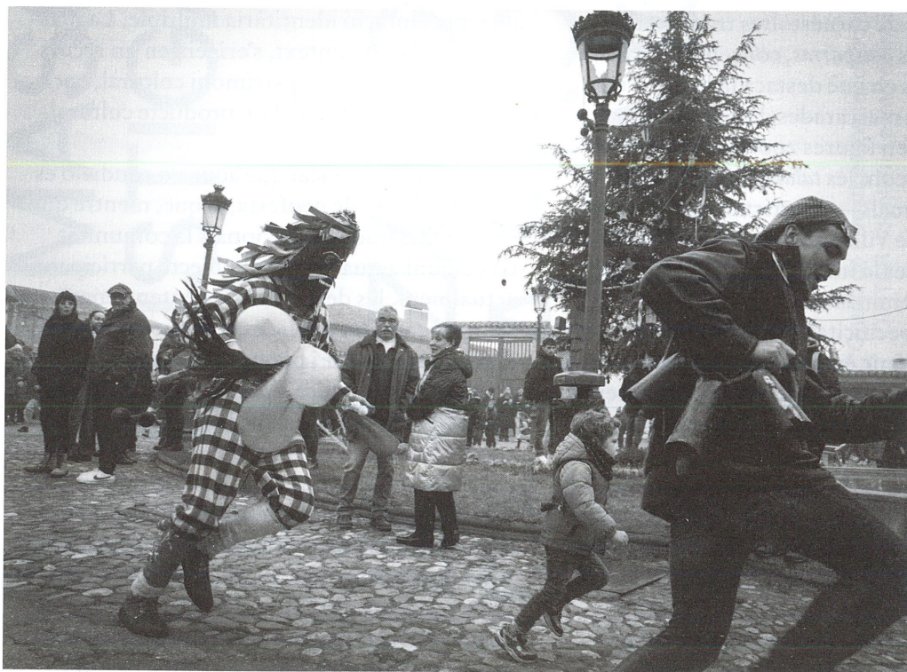
El zangarrón de Sanzoles persegueix els joves.

Més enllà de la data cardinal, aquestes jornades reforcen la continuïtat del ritu i la memòria dels avantpassats. L'emascarat, protagonista central de la mascarada, sol actuar en solitari, encara que a Pozuelo apareix acompanyat de la madama , la senyora, i a Sanzoles, dels dansadors. La seua funció es desenvolupa en l'espai públic i consisteix a executar accions físiques intenses —córrer, saltar, perseguir, colpejar o, a Pozuelo, proferir un crit característic ( ujujear )— que exigeixen destresa i vigor notables, cosa que antigament es vinculava a la demostració de virilitat. Durant la petició de les estrenes, el personatge es manté en silenci i mostra respecte cap als veïns. En les tres estan molt presents els quintos i, des de fa anys, les quintes. En el cas de Pozuelo, les joves ja han participat per sorteig en el personatge