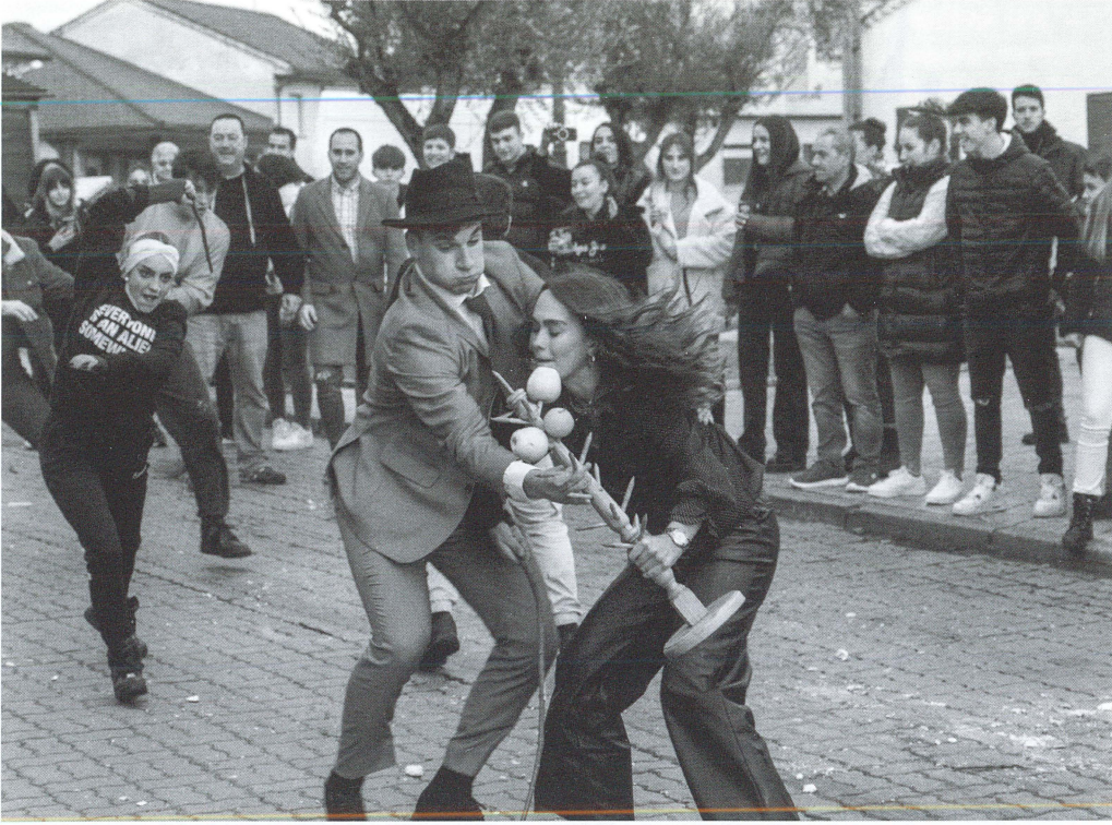
Els entrants de Pozuelo de Tábara defensen el ram de tots aquells que el volen furtar amb tots els mitjans que tenen a l'abast.