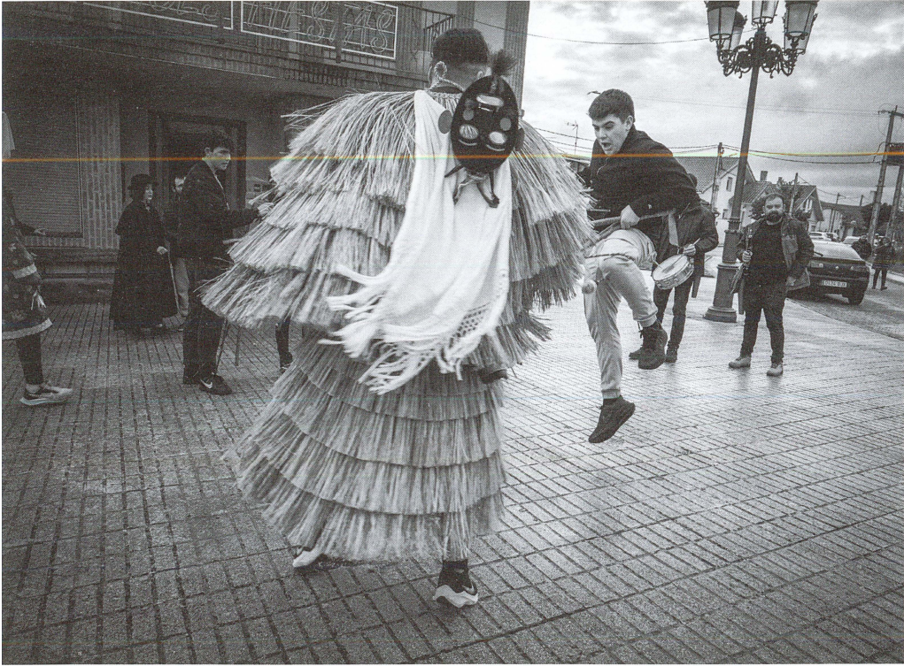
El tafarrón de Pozuelo de Tábara colpeja amb la pilota un jove davant de la mirada dels músics.