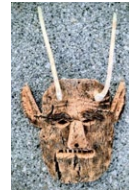
Máscaro de Ousilhão. (Autor: António Tiza);