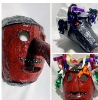
Pecado Mayor, Pecado e Danzante. (Autores: José María Naranjo Romeu, mascareiro; e María del Carmen Almansa Almansa, modista).