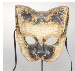
Cat. (Autor: Agostino Dessi, Alice's Masks Studio);