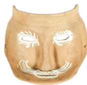
Careta de Bonxe. (Autor: Manuel López);