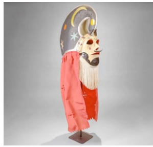
Pantalla. (Autor: Santiago Martínez Santana);