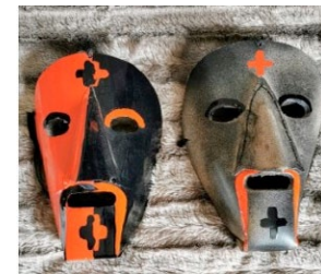
Caretos de Podence.;