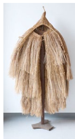
Coroza. (Autora: Viúva de Bugallo);