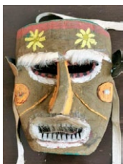
Botarga. (Autor: Ermenegildo Gil);