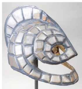
Ola. (Autor: Peter Mitdiel);