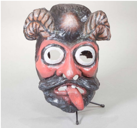
Lucifer. Ubicación: Cervera en Lleida. España.

usadas en Navidad o en Semana Santa para celebrar lo religioso y la fiesta.