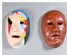
Caretas. (Autor: Carlos Andrés Santos);