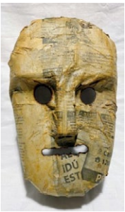
Volante. (Autor: Xosé Manuel Seixas);