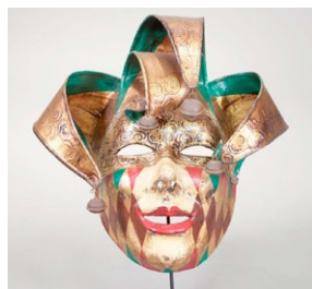
Jolly. (Autor: Flavio Gervasutti);