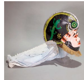
Pantalla. (Autor: Xosé Vilariño);