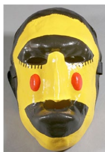
O Colacho. (Autor: Jorge Sancho Santamaría);