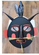
Zangarrón de Sanzoles e Tafarrón de Pozuelo de Tábara. (Autor: José Javier Sánchez);