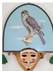
Peliqueiro. (Autor: Francisco Añel, "El sastre de Castro");