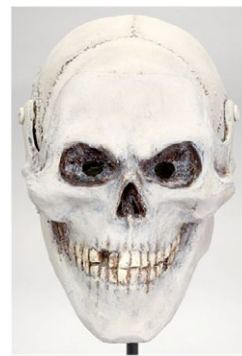
La Mort. (Autor: Escola d'Art d'Olot).