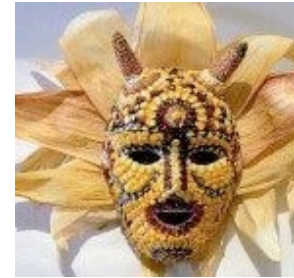
Follateiro. (Autora: Marta Delgado Gómez);