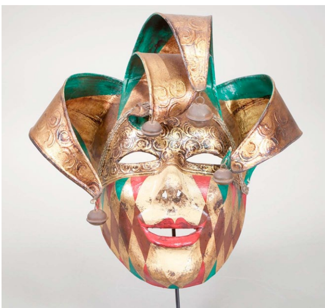
Jolly. Ubicación: Venecia, Italia.

Tiempo de la historia en Europa, entre el siglo 17 y el siglo 18. Las personas llamaban la atención. Eran comunes las fiestas y los carnavales con máscaras.