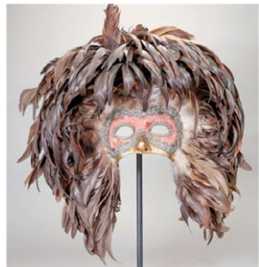
Volto con anteface e toucado de plumas. (Autora: Adriana Mariti);