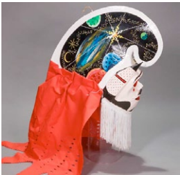
Pantalla. (Autor: Juan);