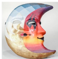
Día e noite. (Autor: Descoñecido);