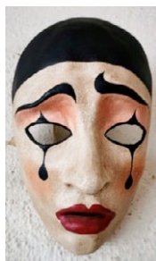
Pierrot. (Autor: Descoñecido);