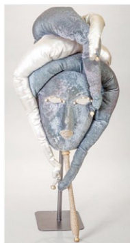
Medusa. (Autora: Paola Paties);