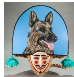
Peliqueiro. (Autor: Richi);