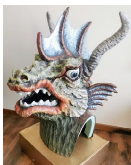
Capròs. (Autores: Ramón Aumedes i Ferré; Taller Sarandaca);

Festa católica. Procesións e adornos florais acompañan estes festexos.