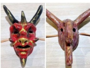
Cornuto e Capra. (Autor: Guiseppe Lombardi);