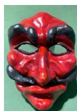
Maestro di Campo. (Autor: Domenico Dino Pinnola);