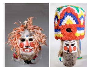
Cuci e Cucoalice. Autor: Constantin Anghel).