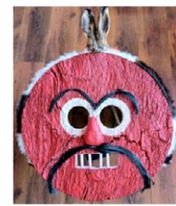
Zangarrón de Montamarta. (Autor: José Ramón Pérez Pérez);