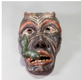
Boteiro. (Autor: Jorge Domínguez Couso, "Minas");