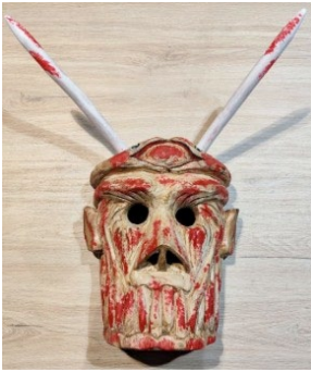
Canhoto. (Diabo) de Cidões (Autor: Amável Alves Antão);