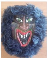
Lole. (Autor: Uwe Constantin);