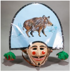
Peliqueiro. (Autor: descoñecido);