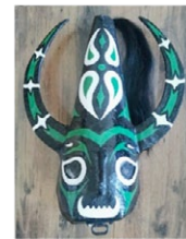
Jarramplas. (Autor: Ernesto Antonio Salgado);