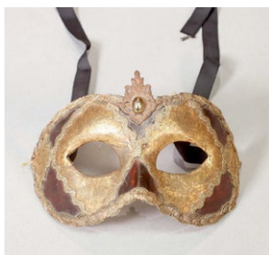
Anteface veneciano. (Autor: Taller Karta Ruga);