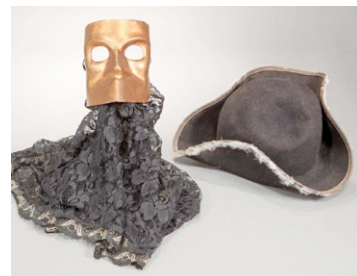
Bauta. (Autor: Descoñecido)