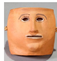
Careta de Bonxe. (Autor: descoñecido);