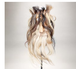
Cucurumacho. (Autores: Pablo de la Fuente y Jacinto Martín);