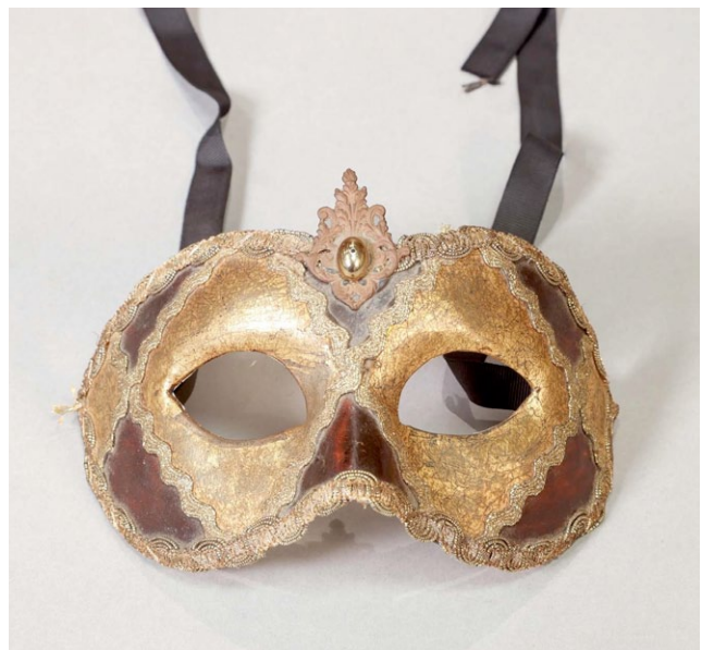
Anteface veneciano. Venecia, Italia.