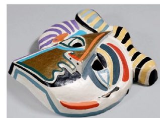
Triangle Collage. (Autor: Taller Arlequín).