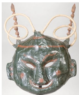
Plen. (Autor: Descoñecido);