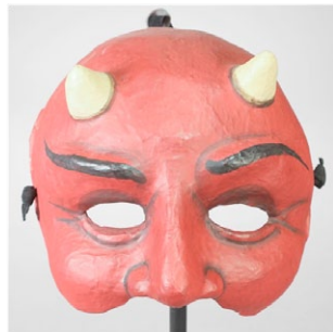
Dimoni. (Autor: Taller Ventura & Hosta Studio);