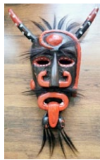
Chocalheiro. (Autor: Carlos Ferreira);