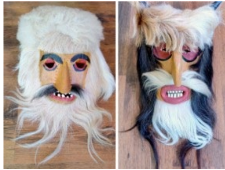
Chipăruș. (Autor: ȘerbanTerțiu).