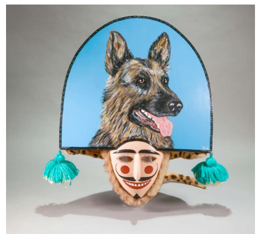
Imagen actual de la exposición MASKS en el Museo do Pobo Galego.

Ahora veremos cada sección con sus máscaras: