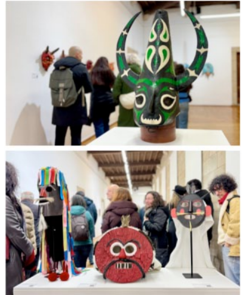
Imagen actual de la exposición MASKS en el Museo do Pobo Galego.

Esta muestra de 66 máscaras en total, enseña al público la importancia de las máscaras en la cultura, en el arte y en las fiestas con piezas únicas hechas a mano.