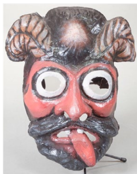
Lucifer. (Autor: Xavi Badia, La Gárgola);