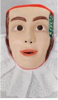
Bugio. (Autor: Manuel António da Silva Pinto Suzano, "Palheira").